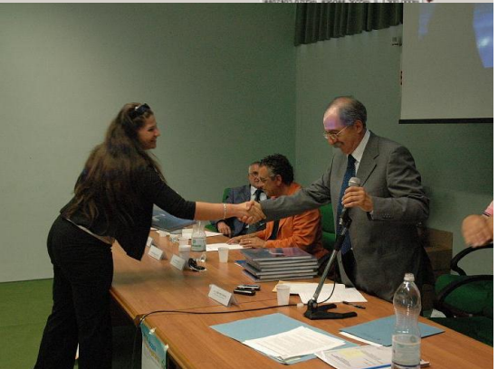
RILIEVO GPS CANALE LIGNARA e premiazione concorso Consorzio di bonifica Destra Sele